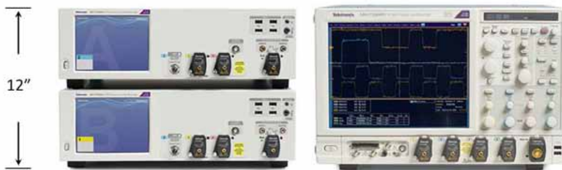
图 6: DPO70000SX 外观紧凑，可以有效利用机架空间，提高通道数量。这里显示了两台 DPO70000SX 示波器（4 条 33 GHz 通道），旁边是一台 MSO73304DX（两条 33 GHz 通道）。

DPO70000SX 外观紧凑，在一台示波器堆叠在另一台示波器顶部时，综合系统的高度只相当于一台泰克高性能示波器（参见图 6），要矮于其他厂商提供的系统。例如，堆叠在一起的两台 DPO70000SX 示波器的高度只有 12 英寸，要低于 Keysight Infiniium Z 系列示波器的 13.3 英寸。尽管物理尺寸较小，但 DPO70000SX 双机配置实际上是一种带宽更高的系统：Keysight Z 系列有两条 63 GHz 通道，而通过电缆连接起来的 DPO70000SX 双机系统则提供了两条 70 GHz 通道。