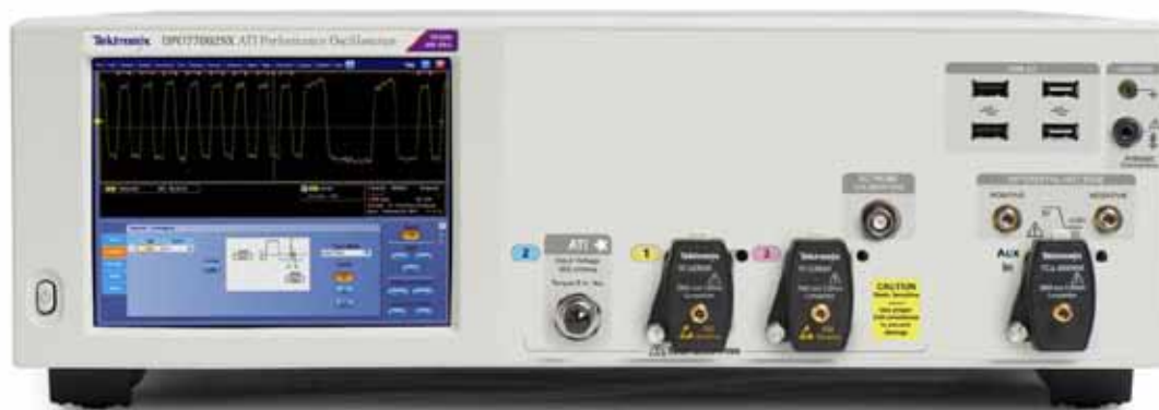
图 1: DPO70000SX 系列示波器外观紧凑，高仅 5.25 英寸，可以放在标准 3U 机架空间中。

如图 1 所示，DPO70000SX 采用 5.25 英寸仪器封装，既可以作单通道系统操作，提供 70 GHz 带宽、200 GS/s 采样率，适用于 RF 和光应用、脉冲式激光器研究及类似的高能物理应用；也可以作为双通道系统操作，每条通道提供 33 GHz 带宽、100 GS/s 采样率，适用于企业高速串行应用及要求差分信号输入的其他应用。