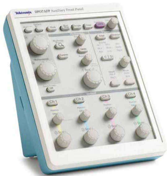
图 3：这里显示了选配的辅助前面板，其提供的用户控件与泰克 DPO7000 和 MSO/DPO70000 系列示波器提供的控件和指示灯一模一样。

除了显示器尺寸更小外，DPO70000SX 还最大限度地降低了示波器上的前面板控件数量。但它有一个选配的辅助前面板（如图 3 所示），提供的用户控件与泰克 DPO7000 和 MSO/DPO70000 系列示波器上提供的控件和指示灯一模一样。辅助前面板有用户熟悉的 Run/Stop 按钮，可以直接进行控制；另外还有与泰克示波器相同的垂直设置、水平设置和触发设置、多功能粗调和微调及其他控件。通过辅助前面板，用户可以从方便的位置全面控制 DPO70000SX，同时把示波器放在最优化的信号采集位置。