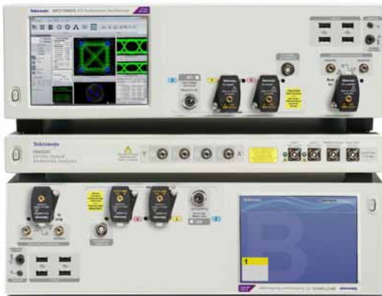
图 8：DPO70000SX 设计成一台仪器可以倒放，这样 ATI 端口可以放在 DUT 附近，缩短电缆长度，保持信号保真度。

由于这些思路和其他设计理念，DPO70000SX 系统异常灵活，可以在 DUT 与示波器之间实现超短信号路径，保持信号保真度，确保最佳的分析结果。