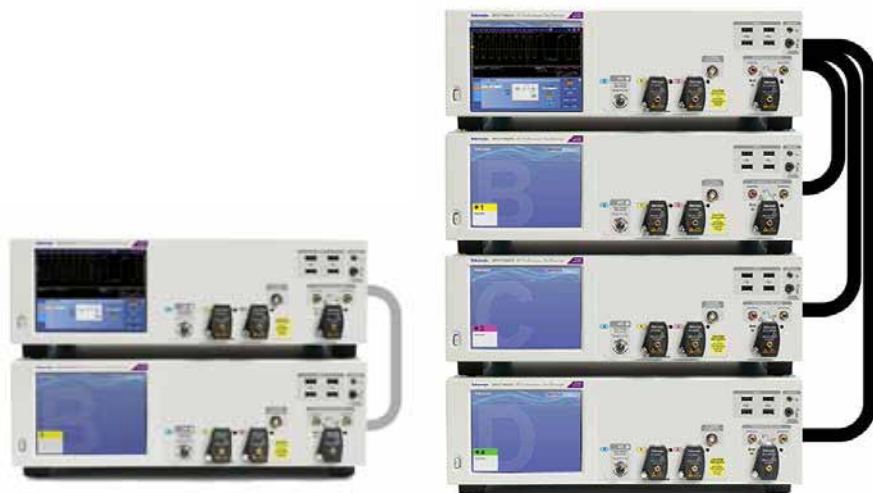
图 4：多台 DPO7000SX 示波器可以方便地连接起来（最多一共可以连接四台示波器），在测试需求变化时，扩展性能和功能。

UltraSync 技术采用 12.5 GHz 采样时钟参考信号，其来自主设备，每台扩展仪器使用这个信号在数字化过程中同步采样位置。扩展仪器通过 PCI Express 第二代 x4 链路控制，这条链路支持 2 GB/s 快速数据传送速率，管理到主设备的数据传送。UltraSync 控制多机系统中所有仪器的触发，因此任何设备都可以作为协调触发源。