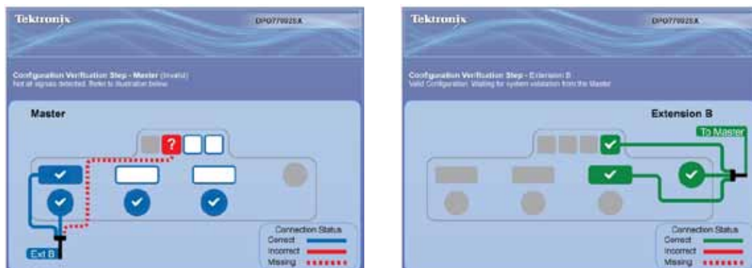
图 5: UltraSync 配置管理器协调多机启动，检验连接。

从用户角度看，UltraSync 总线设置起来非常简便。电缆采用颜色编码，设置简单；连接通过 UltraSync 配置管理器检验。同时，UltraSync 明显改善了系统灵活性和扩充能力。