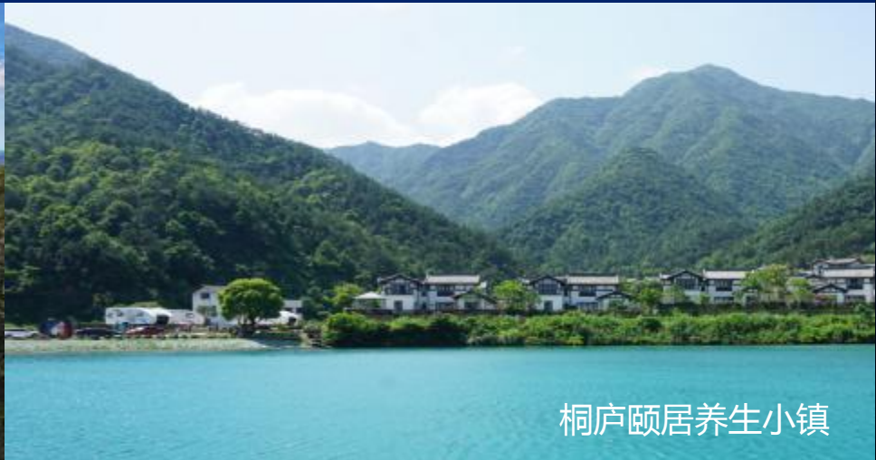
桐庐颐居养生小镇